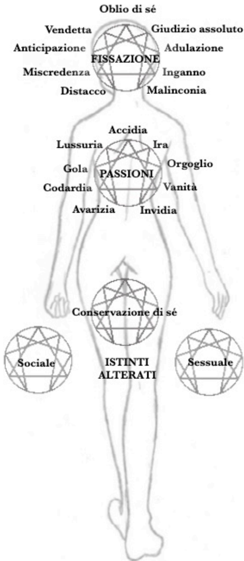
Figura 10 - Enneagrammi della personalità